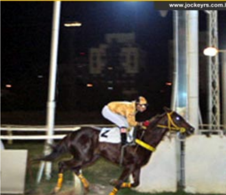
LADY KIKI vence COPA ABCPCC (GRUPO III) e mantém invencibilidade