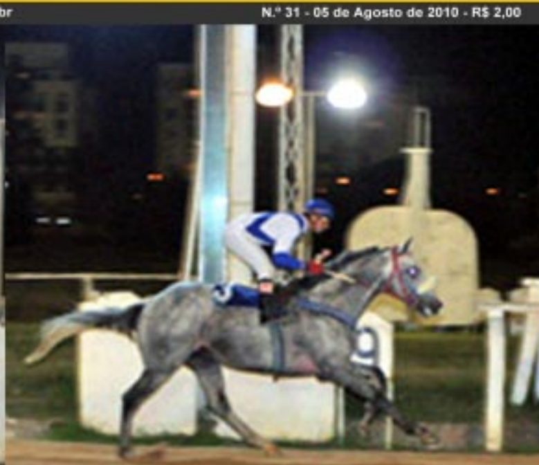
CONDE VIC vence Grande Prêmio Governadora do Estado - Handicap de Tordilhos